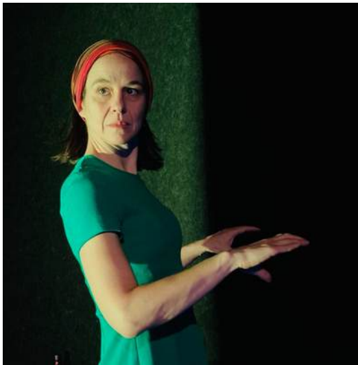
FrontièreS , Théâtre de l'Arlequin, Cherbourg, avril 2026 Reconstitution 2, Celle qui dit oui

Les costumes ont des couleurs vives, primaires, avec tout un jeu sur les couleurs complémentaires dans une esthétique visuelle des années 60 qui rappelle certains tableaux d'Edward Hopper.