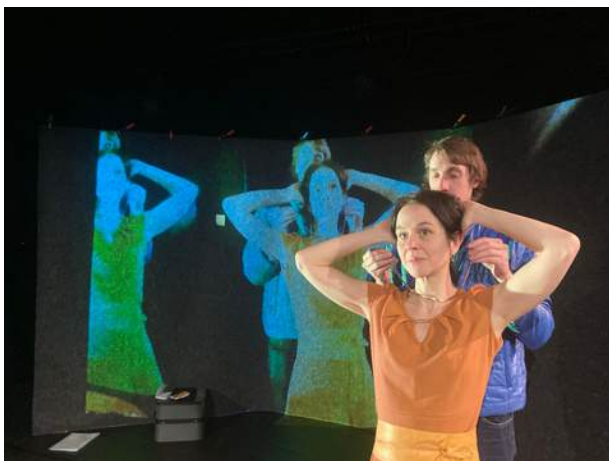
FrontièreS , Théâtre de l'Arlequin, Cherbourg, avril 2026 Reconstitution 3, Nina une femme allemande (cinéma)