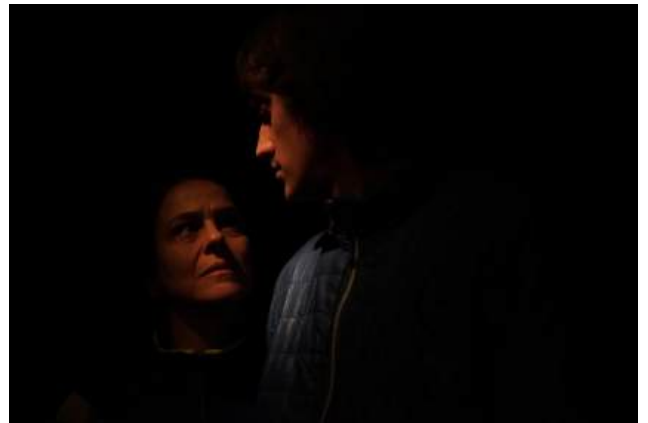
FrontièreS , Théâtre de l'Arlequin, Cherbourg, avril 2026 Reconstitution 1, Celle qui dit non , (clair-obscur)

La vidéo fait aussi l'objet d'un travail esthétique différencié. Dans la Reconstitution 3 (Nina, une femme allemande) la complexité de la relation entre le frère et la soeur nous conduit à un traitement vidéo en prise directe avec des formes de projections diffractées.