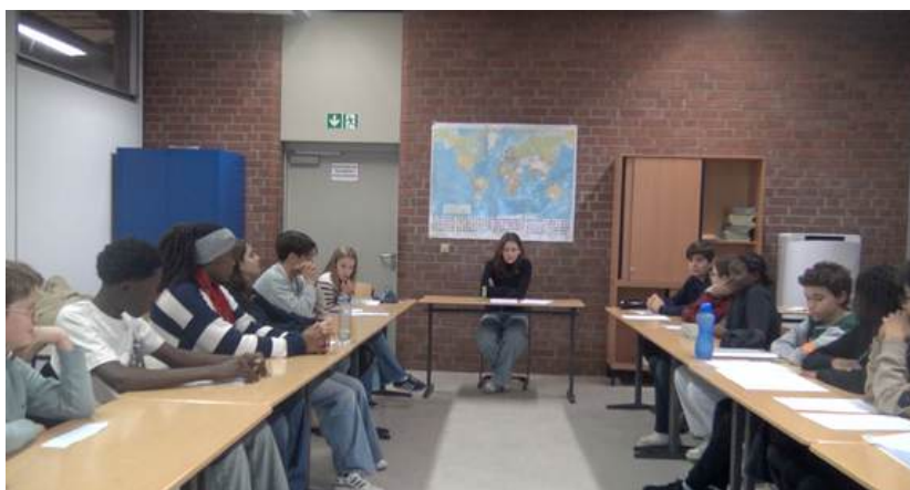
Lycée Français de Berlin, décembre 2024, le procès Franz K. par des élèves de collège