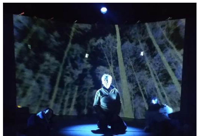
FrontièreS , Quai des Arts, Argentan, février 2026, (Binaire 1)

Parallèlement, son activité de graphiste et d'illustrateur le conduit à écrire de nombreux scénarios.