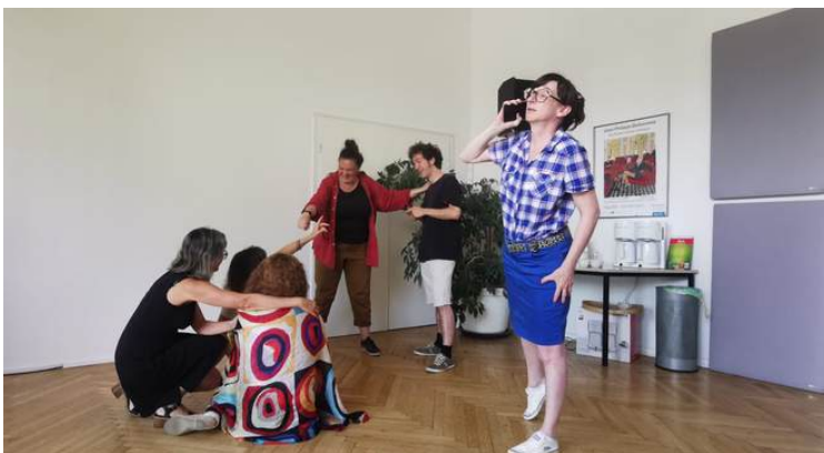
Jeux pour acteurs et non acteurs avec des adultes, Berlin, 2023

Texte écrit à partir d'un stage Erasmus+ animé par Frédéric Barriera à Berlin (il s'agissait alors d'organiser un procès citoyen pour en éprouver la méthodologie), puis travaillé en atelier avec des élèves de l'option théâtre du Lycée Français de Berlin, FrontièreS se prête particulièrement à un travail avec des élèves lycéens. Outre la version scénique, une version "salle de classe" sera préparée par la compagnie. Ainsi des rencontres pourront être organisées et provoquer des échanges féconds avec les publics lycéens, notamment autour des questions de liberté de conscience et de responsabilité individuelle.