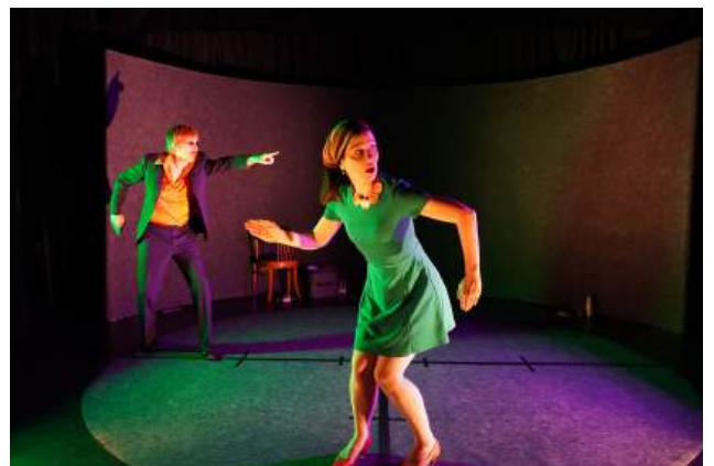
FrontièreS , Théâtre de l'Arlequin, Cherbourg, avril 2026 Reconstitution 2, Celle qui dit oui , (roman-photo)