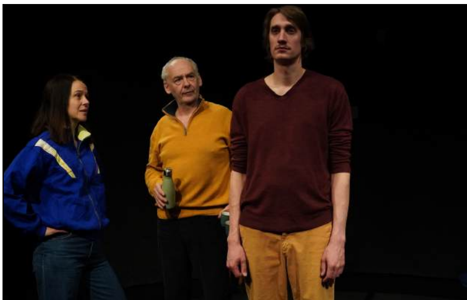
FrontièreS , Théâtre de l'Arlequin, Cherbourg, avril 2026

Après Justice 67 , qui interrogeait la capacité des citoyens à s'emparer de la justice quand les États se montraient défailants, Frédéric Barriera continue son questionnement des fondements de nos démocraties. Avec FrontièreS , ce sont cette fois les frontières politiques, esthétiques, morales et intimes qui traversent l'histoire européenne... et nos propres choix, qui sont interrogées.