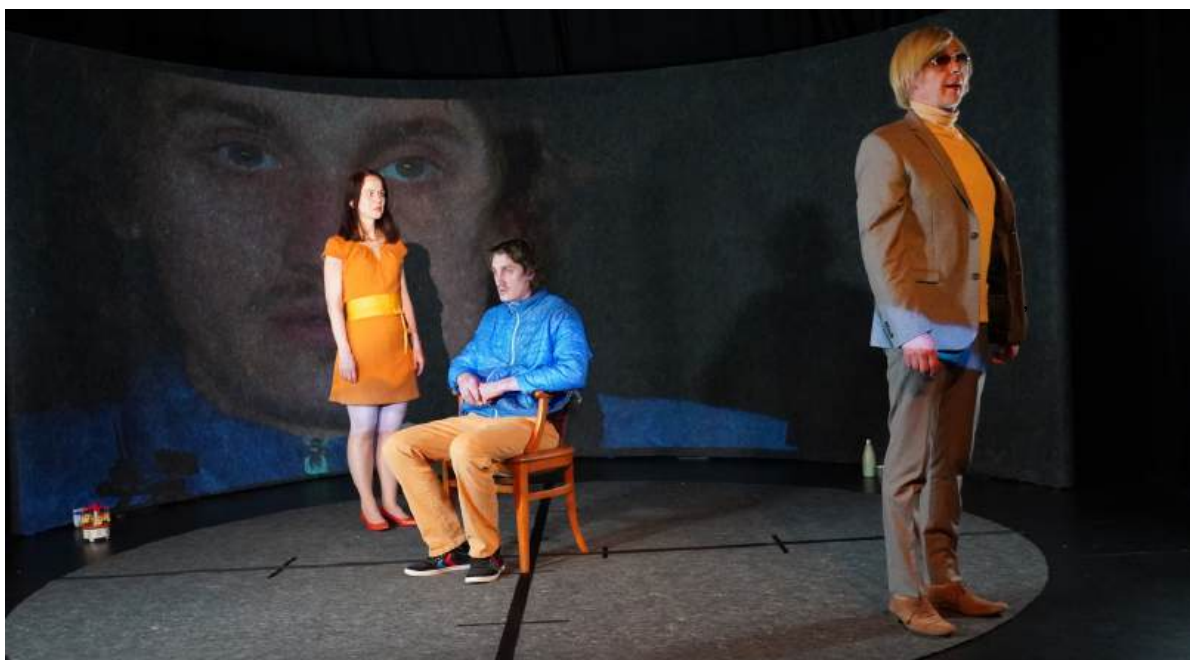
FrontièreS , Théâtre de l'Arlequin, Cherbourg, avril 2026 Reconstitution 3, Nina, une femme allemande