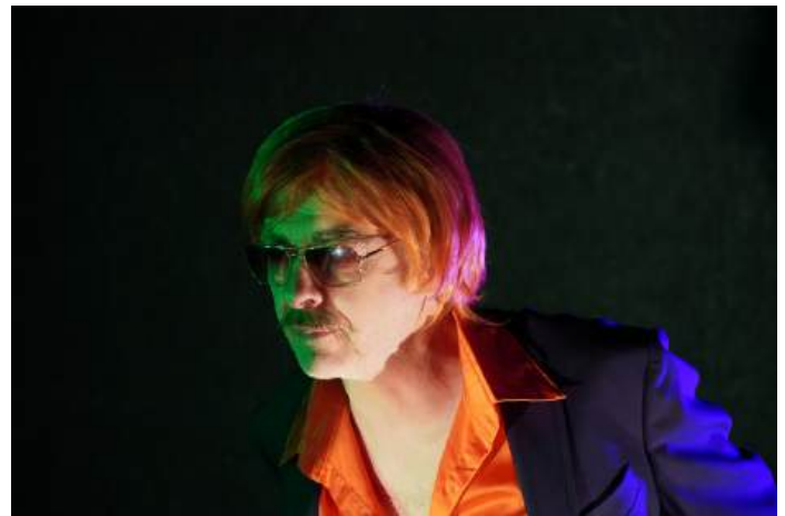
FrontièreS , Théâtre de l'Arlequin, Cherbourg, avril 2026 Reconstitution 2, Celle qui dit oui

Les moments documentaires (témoignages réels, faits énoncés comme objectifs) mettent en question le réalisme. La logique du "procès" est déconstruite pour laisser place à une logique où l'imaginaire vient nourrir la pensée. "Juger" devient une urgence démocratique. Le spectateur est mis devant des interrogations : les réponses qu'il apportera dans la solitude de sa pensée ou dans la confrontation avec d'autres constitueront des points d'appui intellectuels et moraux, des points cardinaux pour s'orienter dans la confusion de notre époque.