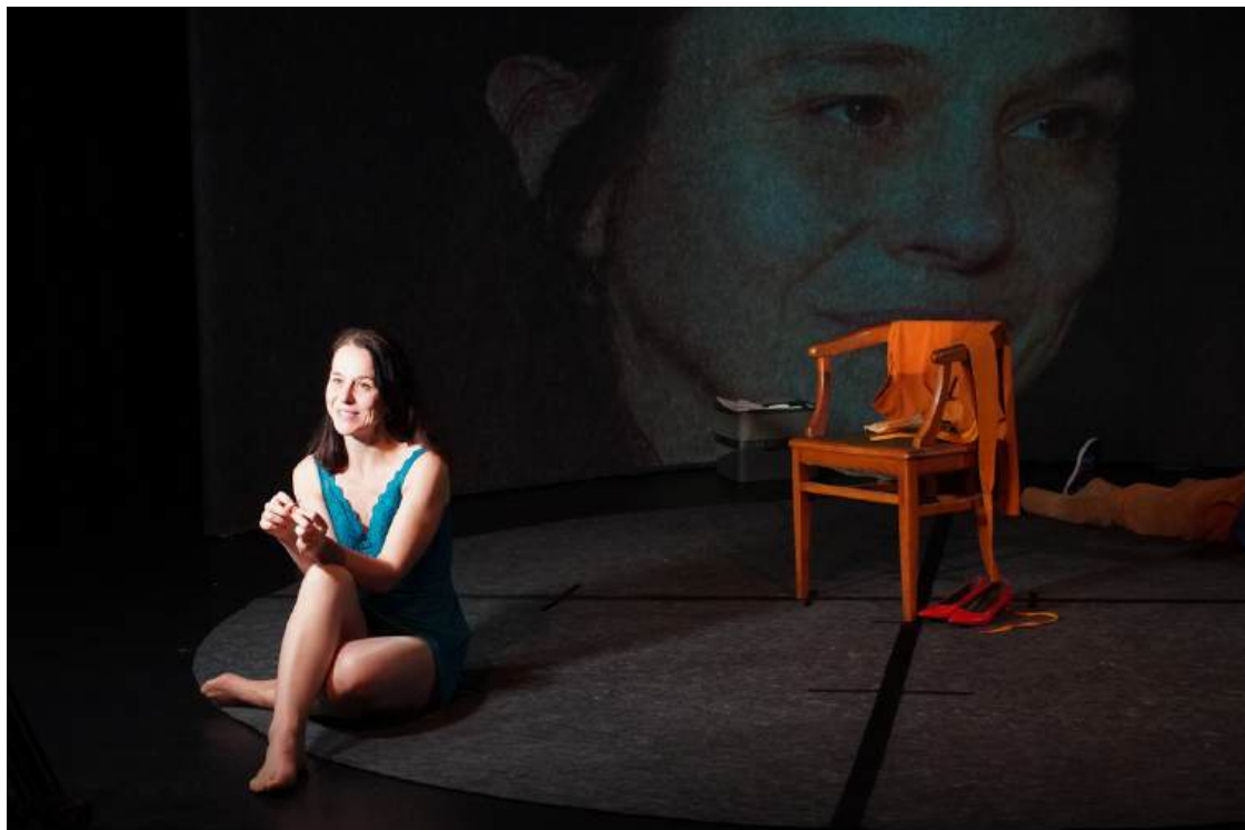
FrontièreS , Théâtre de l'Arlequin, Cherbourg, avril 2026 (Reconstitution 3, Nina une femme allemande )