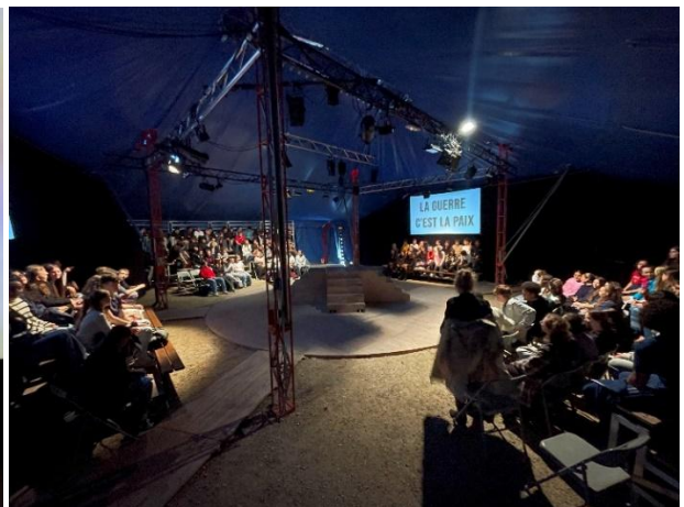
Représentation sous chapiteau