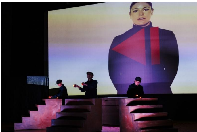
Représentation en salle de spectacle

Le spectacle s'adapte cependant à divers lieux. L'adaptation en salle implique une version frontale de la mise en scène, qui permet de renforcer encore l'omniprésence des écrans.